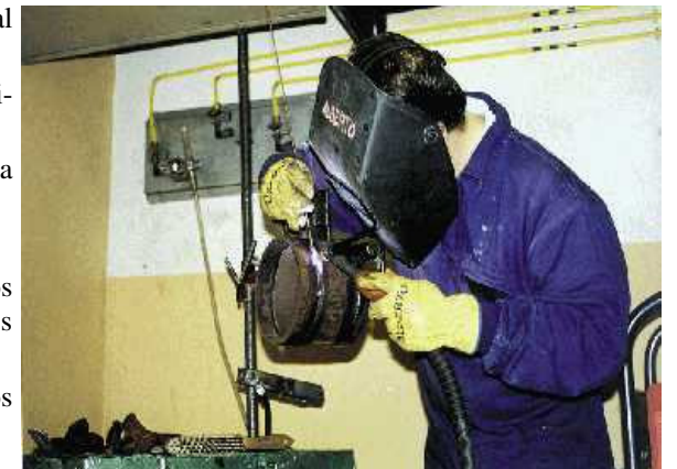
Grado Medio de Soldadura y Calderería en nuestros locales de Belategi